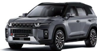
플래티넘 그레이 ADA