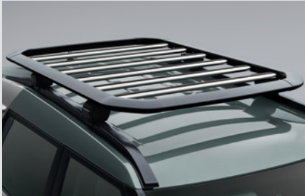
루프 플랫폼 캐리어 800,000원