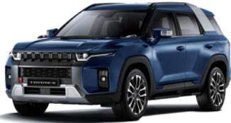
만디 블루 BAS