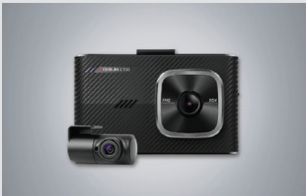
아이나비 블랙박스(16GB) 220,000원