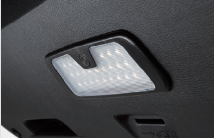
테일게이트 LED 램프 120,000원