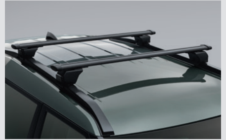
루프 크로스바 450,000원