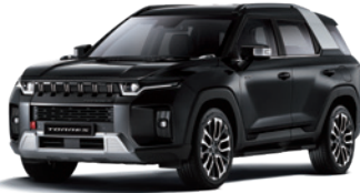
스페이스 블랙 LAK

* 1Tone : 루프 / 스포일러 : 바디 컬러, C필러 : 실버 컬러