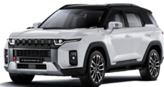
그랜드 화이트 WAA