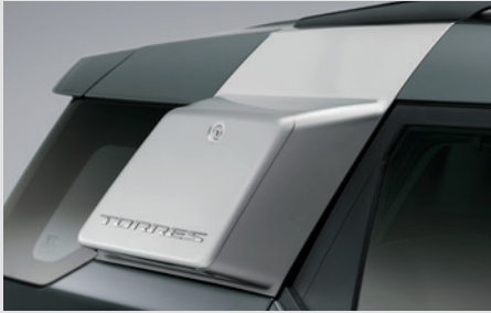
사이드 스토리지 박스(1tone/2tone) 300,000원