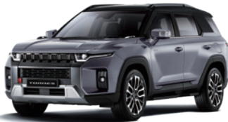
아이언 메탈 ADE