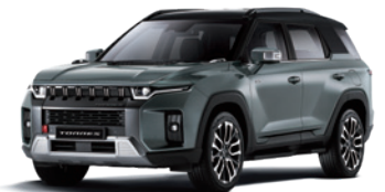
포레스트 그린 GAO

* 2Tone : 루프 / 스포일러 / C필러 : 블랙 컬러(LAE) * 2Tone 선택 시 세이프티 선루프 선택 불가 * 본 가격표에 수록된 제품의 색상은 인쇄된 것이므로 실제 색상과 다소 차이가 있을 수 있습니다.