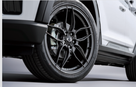
20인치 단조휠 2,980,000원