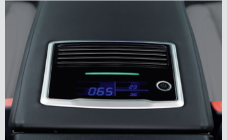
빌트인 공기청정기 400,000원