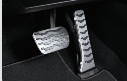
스포츠 페달 40,000원